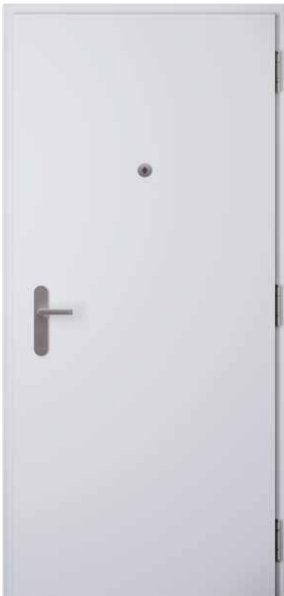
Vstupní dveře Elegant Komfort 10