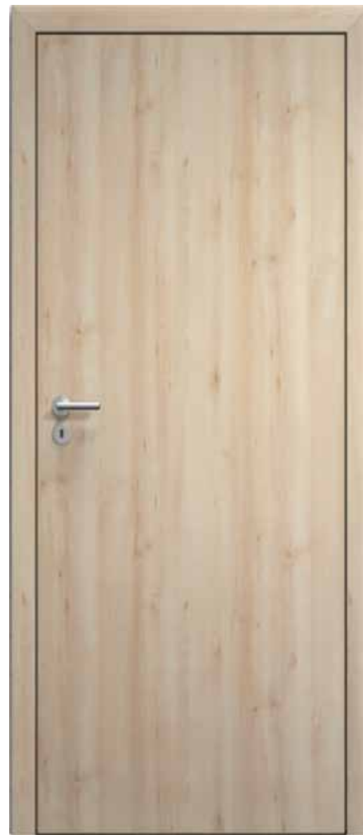
Interiérové dveře s povrchem CPL buk