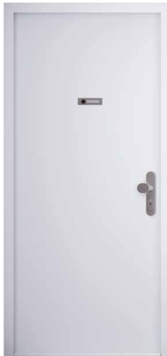
Vstupní dveře Elegant Komfort 10