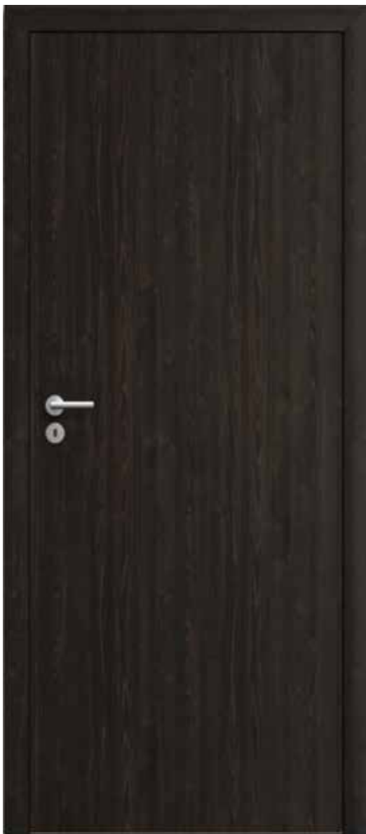
Interiérové dveře s povrchem CPL wenge