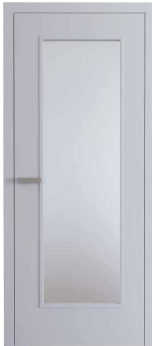
Interiérové dveře Elegant Komfort 40