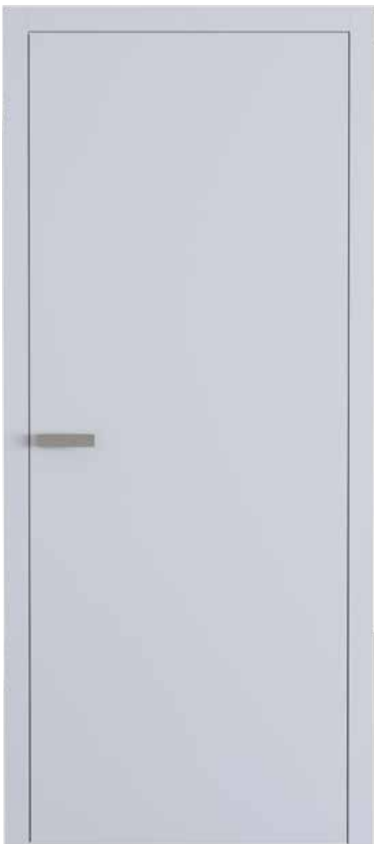
Interiérové dveře Elegant Komfort 10